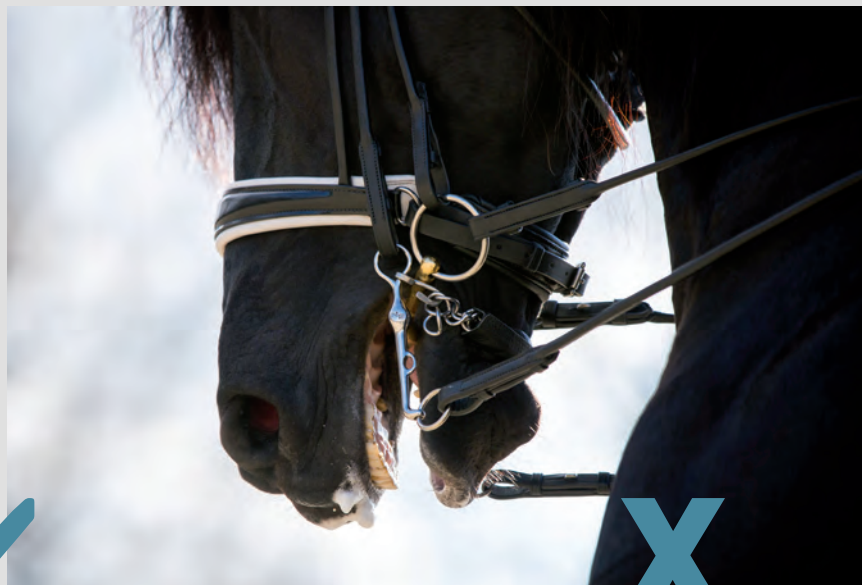
Hugo is onrustig met zijn mond en doet af en toe zijn mond open.