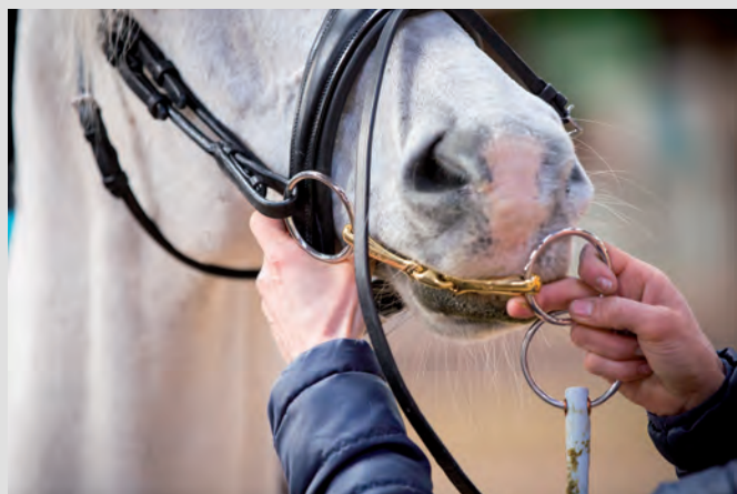
Een bit moet zo worden gehangen dat het hoofdstel makkelijk over de oren kan. Bungelt het bit en kun je het door de mond halen, dan hangt het te laag.