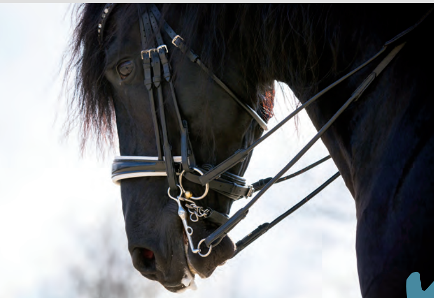
Hugo houdt zijn mond mooi gesloten en zoekt de hand van de ruiter.

Tekst: Tessa van Daalen • Fotografie: Fleur Louwe